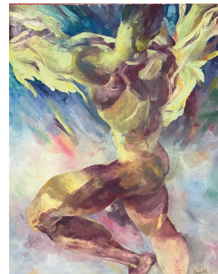
CANDÉ « Icare », signé en bas à droite 80 x 65 cm