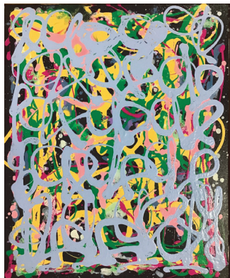
L'AKHAL , composition abstraite signée en bas à droite, acrylique sur toile 50 x 60 cm