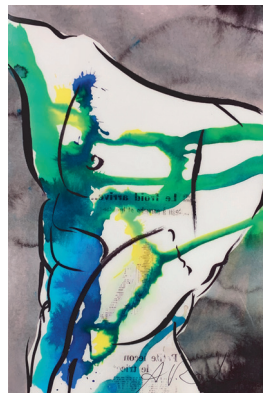
Anne-Claire ROCHE " Nu " Œuvre numérique sur plexi, signée en bas à droite 1/30 90 x 60 cm